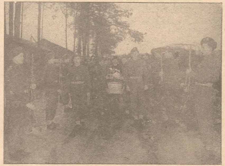
LUITVAART IN AMERSFOORT